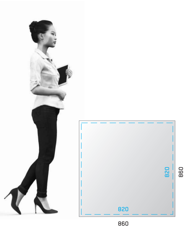
FRONT SAMBA FRONT SAMBA